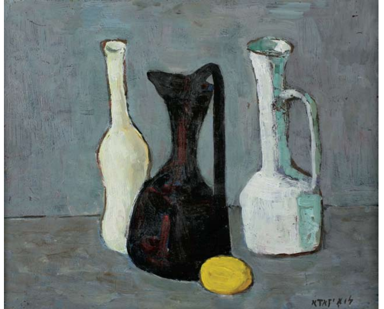
אביגדור לואיזאדה, טבע דומם, 1948 בקירוב

Danon, 1953, oil on canvas, 81x101, private collection