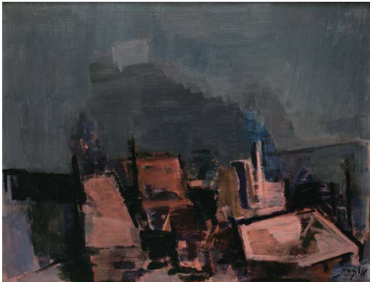
משה מוקדי, נוף ירושלים, 1950 בקירוב שמן על בד, 81x100, אוסף משכן לאמנות עין-חרוד, מתנת הדי מוקדי

Moshe Mokady, Jerusalem Landscape , ca. 1950, oil on canvas, 81x100, collection of Museum of Art, Ein Harod, gift of Hedy Mokady