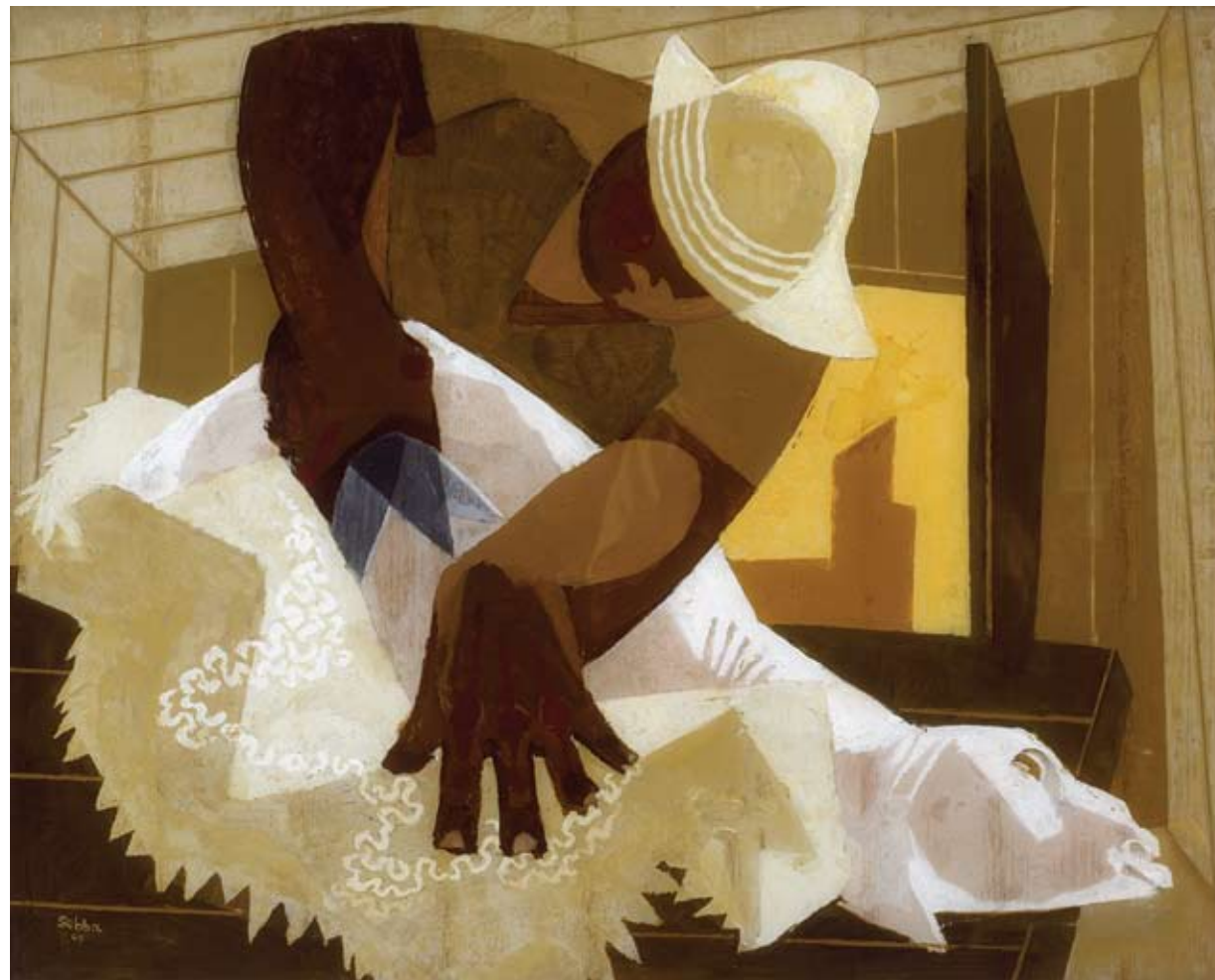
שלום סבא, הגז, 1947 שמן על פרספקס, 48x63, אוסף מוזיאון תל-אביב לאמנות (פרס דיזנגוף 1953) Shalom Sebba, The Shearing , 1947, oil on Perspex, 48x63, collection of Tel Aviv Museum of Art (Dizengoff Prize 1953)