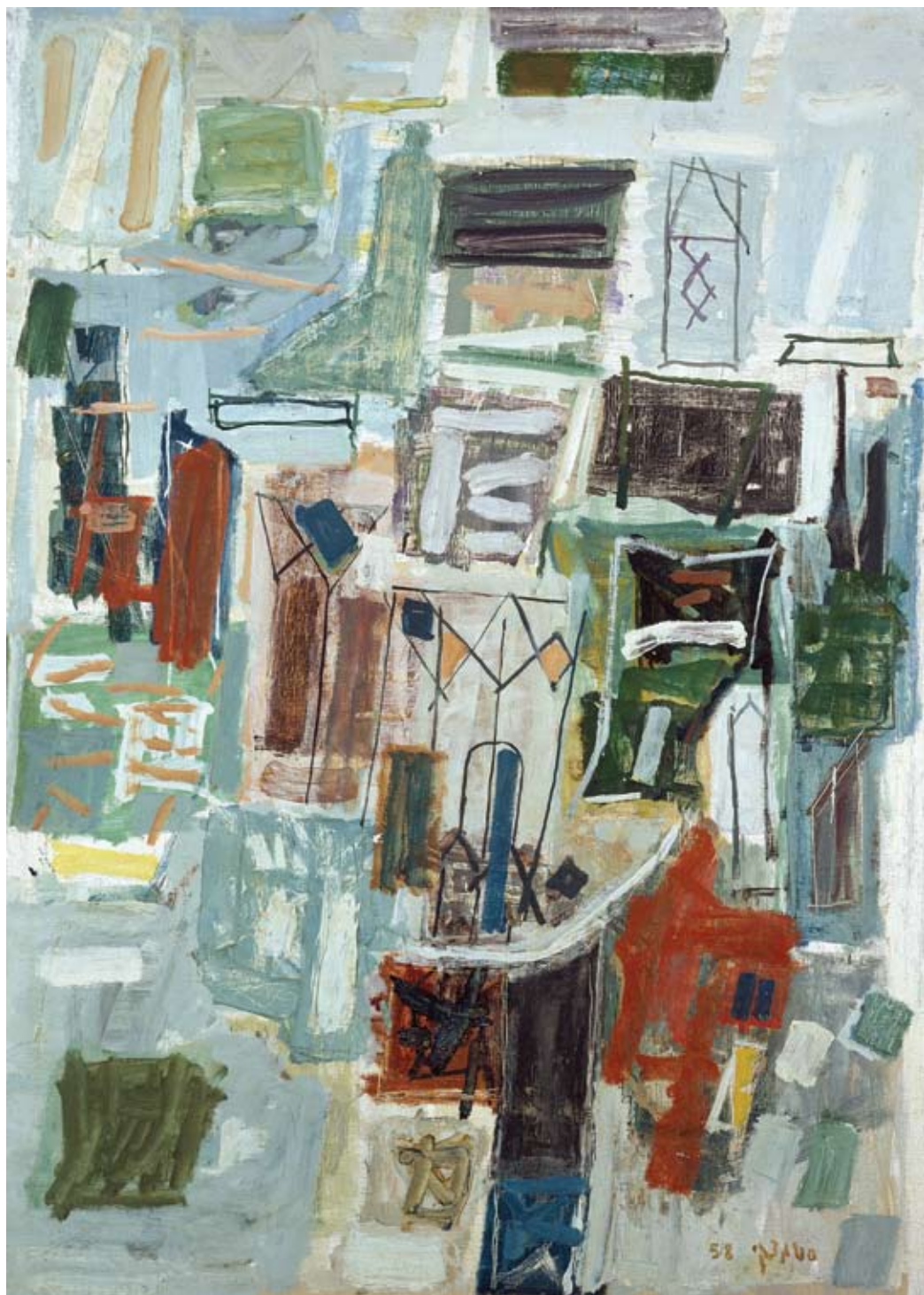
אביגדור סטמצקי, לפי מבנה בנוף, 1958 שמן על בד, 136x100, אוסף מוזיאון תל-אביב לאמנות Avigdor Stematsky, After a Structure in the Landscape , 1958, oil on canvas, 136x100, collection of Tel Aviv Museum of Art