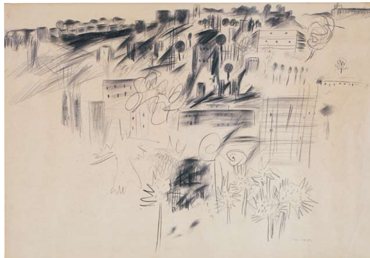
אביבה אורי, נוף, ראשית שנות ה-50 עיפרון ופחם על נייר, 34.5x49.5, אוסף מאיה פרידנרייך, אורנית

Moshe Mokady, Jerusalem Landscape , ca. 1950, oil on canvas, 81x100, collection of Museum of Art, Ein Harod, gift of Hedy Mokady