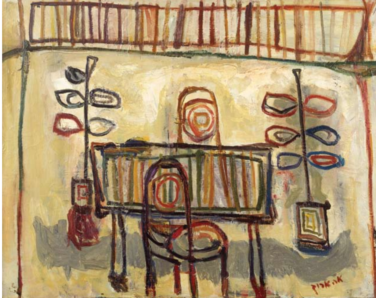
אריה ארוך, סוכה, 1953

שמן על בד, 63.5x79, אוסף מוזיאון ישראל, ירושלים