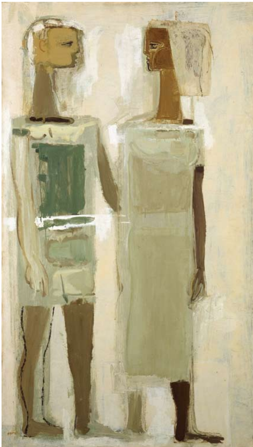
משה פרופס, נעורים, 1955 בקירוב שמן על בד, 140x80, אוסף מוזיאון תל-אביב לאמנות Moshe Propes, Youth , ca. 1955, oil on canvas, 140x80, collection of Tel Aviv Museum of Art