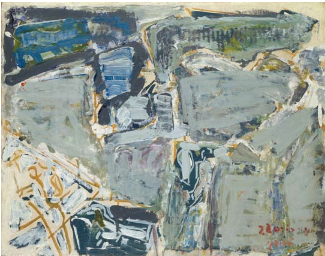
יוסף זריצקי, יחיעם, 1952 שמן על בד, 40x50.5, באדיבות גלריה גורדון, תל-אביב

Yosef Zaritsky, Yechiam , 1952, oil on canvas, 40x50.5, courtesy of Gordon Gallery, Tel Aviv